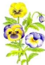
В Анютины глазки